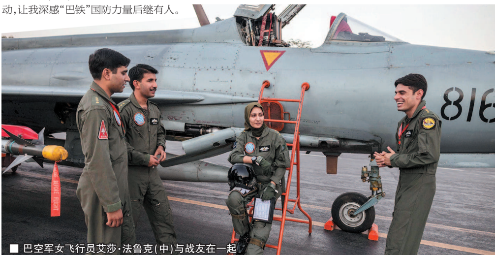
■ 巴空军女飞行员艾莎·法鲁克(中)与战友在一起