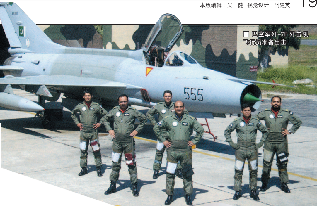
□ 巴空军歼-7P 歼击机 飞行员准备出击