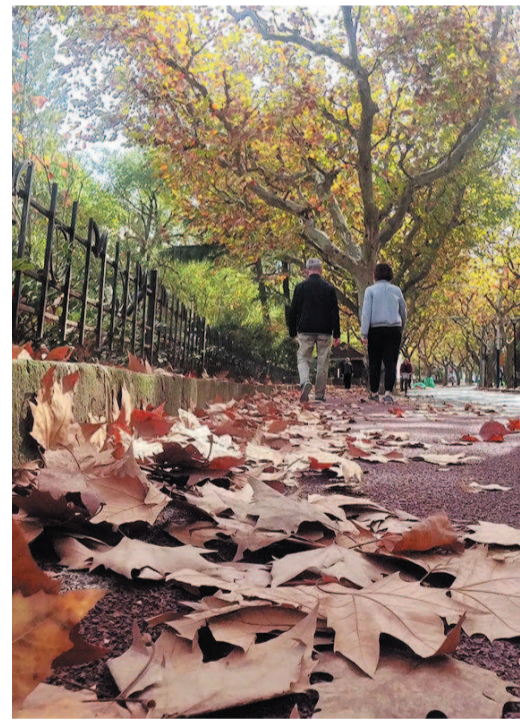
融合了烟火气与文艺范的花溪路

浦东新区大道站路北侧, 15年了, 近1公里长的路上竟然没有灯。三林世博家园A区B区L区4125户居民, 天黑不敢夜行。路路路, 何时能被照亮? 盼盼盼, 居民翘首以待!