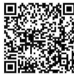
扫码看 花溪路落叶