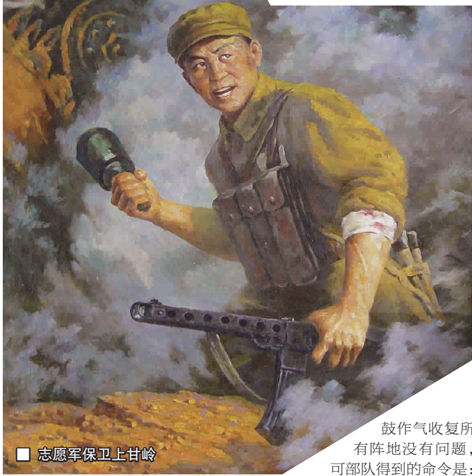
■ 志愿军保卫上甘岭