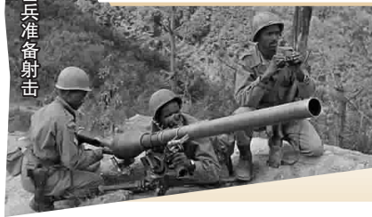
■ 埃塞士兵准备射击

最近，美国历史学家达马维·阿比比撰写的《非洲保镖营》一书出版，首度披露70年前埃塞俄比亚（简称“埃塞”）皇家军队参加朝鲜战争的内幕，在评价他们与中国人民志愿军交战的情况时，阿比比的评价是“这帮人的骄狂劲被彻底打没了”。