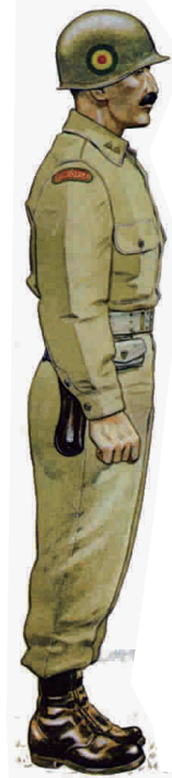
■ 埃塞步兵营营长安多姆中校

根据美方公布的数据，埃塞军在朝鲜战争中死亡121人、受伤536人，伤亡率超过60%，可以视为丧失战斗力。值得一提的是，侵略埃塞步兵营营长安多姆后来成为1974年埃塞建立共和国后的首位国家元首。 侯涛