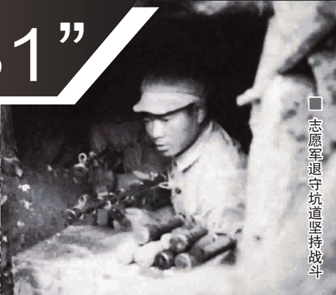
■ 志愿军退守坑道坚持战斗

惊天地、泣鬼神的抗美援朝战争上甘岭战役已过去近70年了，但中国人民志愿军在那场持续43天的较量中所表现出的英雄主义精神，至今都让人无比崇敬。现在，我们要讲述的是其中1952年10月31日当天的战斗。那一天，中国军人一口气粉碎了多国军队的轮番进攻，在那片焦土上铭刻了不朽的功勋。