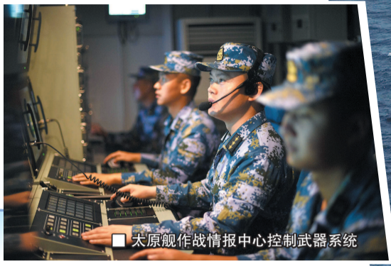
太原舰作战情报中心控制武器系统

2008年12月26日,中国海军首批护航编队奔赴亚丁湾、索马里海域,从此在国际公认的危险水域有了维护和平的中国力量。到今年底,中国海军参加护航已逾12年,为超过6800艘中外商船提供保护,赢得一致赞誉。普通人一直很好奇,我官兵在护航行动中有哪些鲜为人知的故事?有什么独特的体验?相信这篇来自刚回国的海军131编队的报道,能给您带去满意的回答。