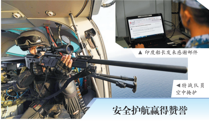
印度船长发来感谢邮件