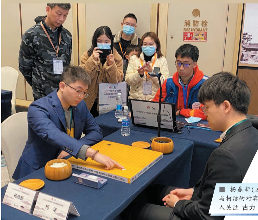
■ 杨鼎新(左)与柯洁的对弈引人关注