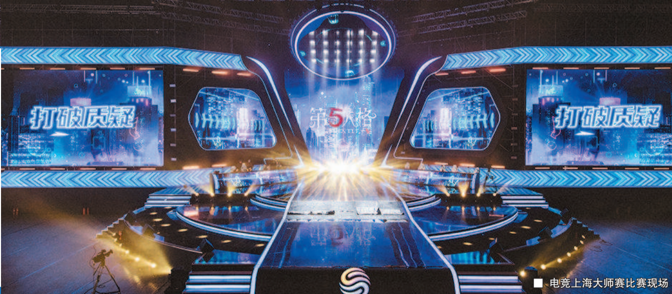
■ 电竞上海大师赛比赛现场

一阵阵欢呼声从静安体育中心里传来，整座场馆都被耀眼的“电光蓝”所包裹……昨晚，继英雄联盟全球总决赛(S10)之后，又一项电竞大赛——为期5天、涉及5个比赛项目的2020电竞上海大师赛在申城圆满落幕。本届比赛在首届基础上增加了《王者荣耀》《第五人格》《荒野乱斗》三个全新移动端电竞项目。因为疫情的影响，电竞上海大师赛也成为游戏《守望先锋》今年中国首场线下大型赛事。