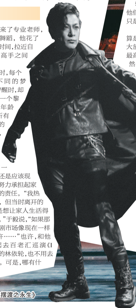
于毅主演《灵魂摆渡之永生》

年少时，每个人都有不同的梦想，可是梦醒时，却要面对同一个黎明。随着年龄增长，和所有逐渐成熟的男人一样，于毅也在思考，究竟是为了梦想不顾一切重要，还是应该现实一点，努力承担起家庭和生活责任。“我热爱音乐剧，但当时离开的原因，只是想让人家生活得更好一点。”于毅说，“如果那时的音乐剧市场像现在一样繁荣，也许……”也许，和他当年一起去百老汇巡演《I love you》的林依轮，也不用去直播带货。可是，哪有什么也许。