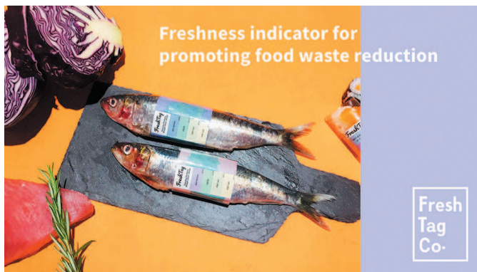
英国皇家艺术学院作品