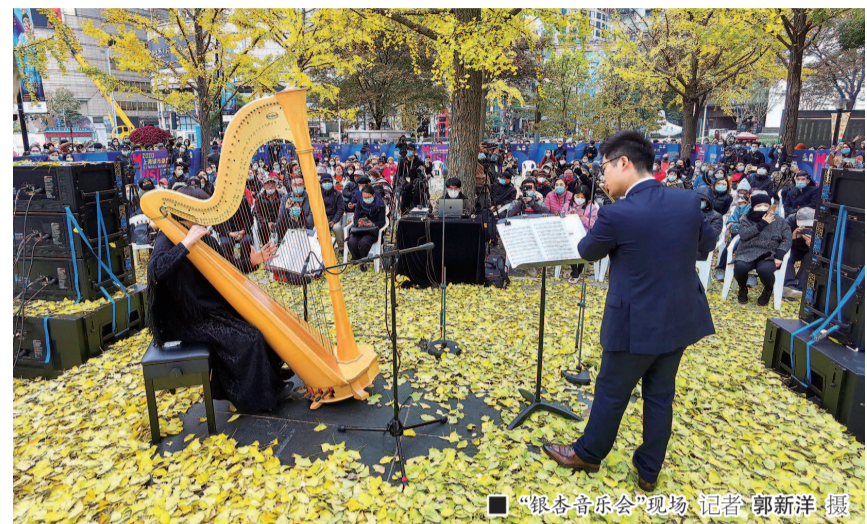
■ “银杏音乐会”现场