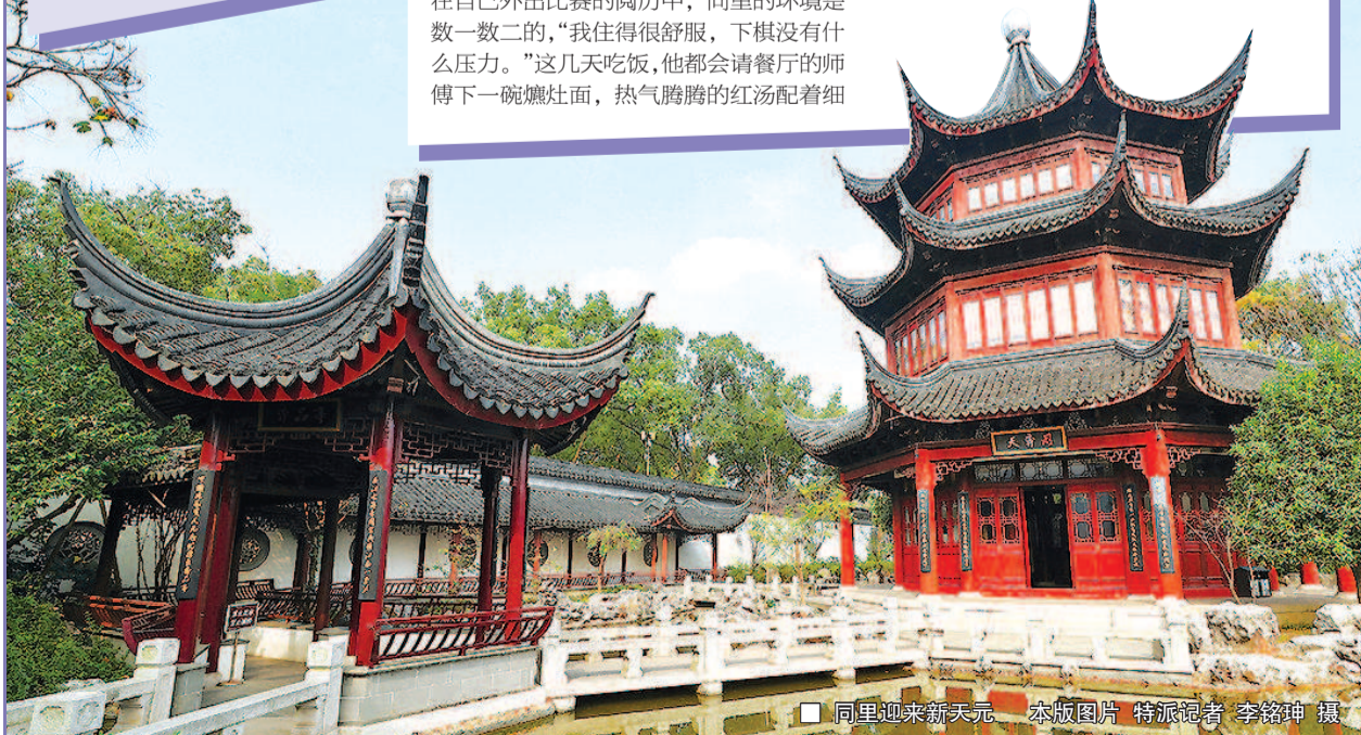
同里迎来新天元