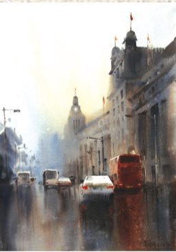
▲ 当代建筑师胡瑜画作