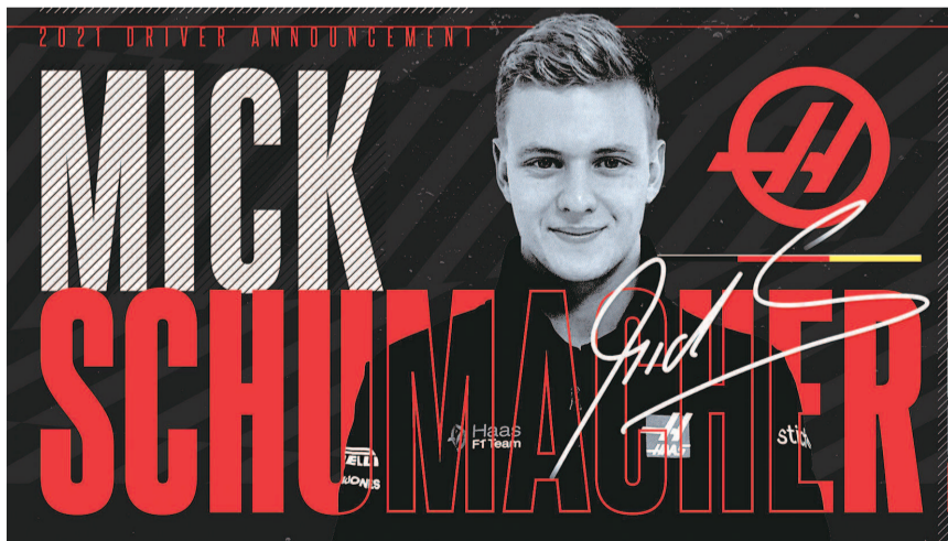
哈斯车队宣布签约米克·舒马赫的海报