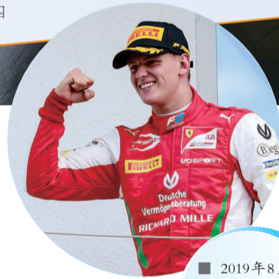
2019年8月4日，米克·舒马赫首次获得F2单站冠军