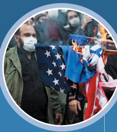
■ 伊朗首都德黑兰民众焚烧以色列和美国国旗

年初伊朗革命卫队司令苏莱曼尼之死已让伊朗人出奇愤怒。面对年末的又一场暗杀,伊朗最高领袖哈梅内伊28日发布声明,说伊方首要事项是“明确惩罚”凶手和下令杀害法赫里扎德的人。