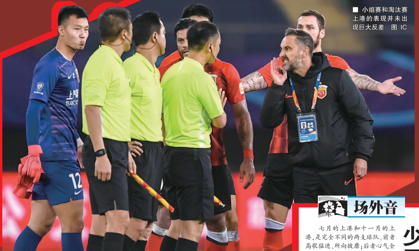
■ 小组赛和淘汰赛 上港的表现并未出现巨大反差

要知道国安也是兵强马壮、志在冠军，想要“双杀”这样一支球队并不容易。因此当时外界都认为，联赛诸强中也就恒大能够有实力与上港一战。