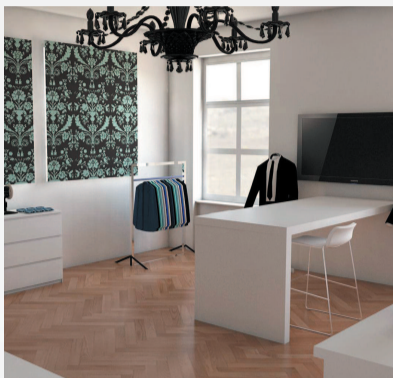
▲ ▲ ▲ 设计周作品