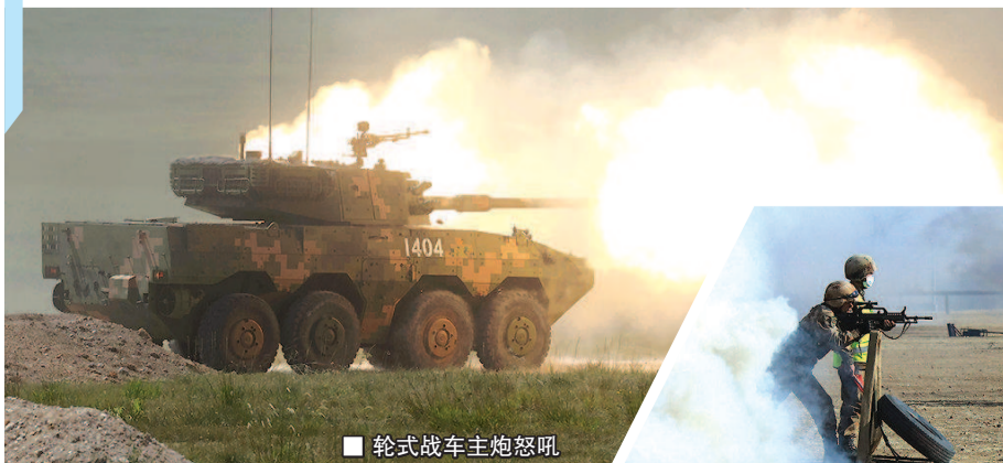
轮式战车主炮怒吼