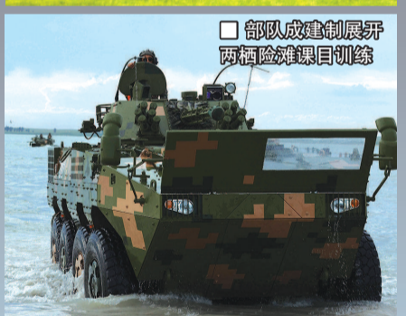
部队成建制展开两栖险滩课目训练