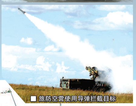
旅防空营使用导弹拦截目标