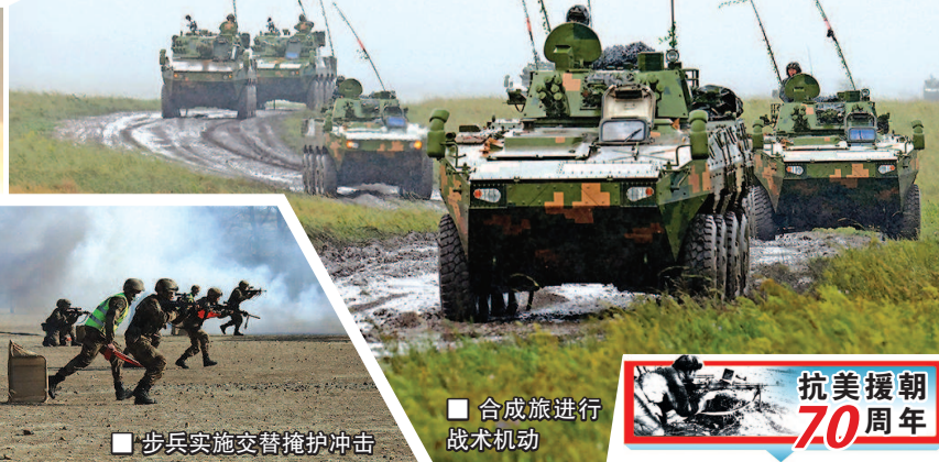
步兵实施交替掩护冲击