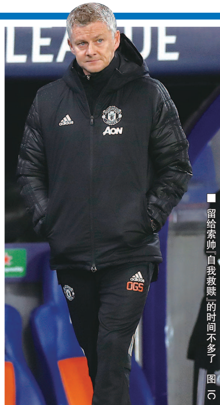
■ 留给索帅「自我救赎」的时间不多了

第一阶段联赛还有一周多就要打完,之后其他球队的主教练可以休息一下,但杜锋还要继续连轴转,因为国家队窗口期比赛在等着他。他说,无论在联赛还是国家队,调教年轻队员是既痛苦又快乐的经历,“训练,比赛,剪录像,看录像……有时候确实觉得挺累。但是,你通过自己和团队的努力,能够看到年轻队员的进步和成长,那种喜悦也是常人无法体会的。” 本报记者 李元春