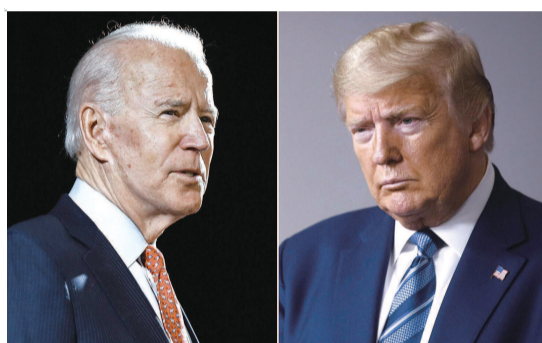
▲ 部分州计票工作仍在进行