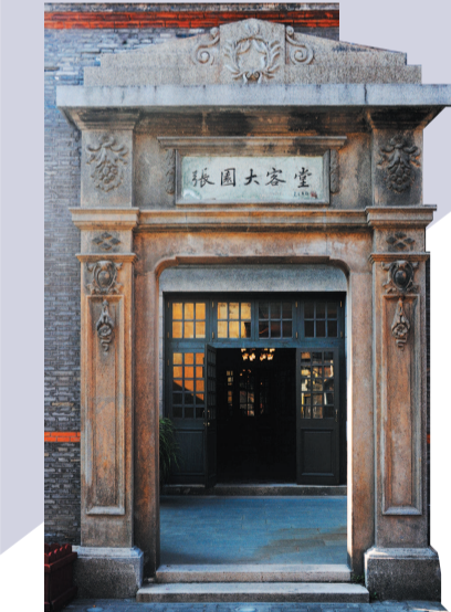
■ 张园如今是网红打卡地

经过数年努力,我们可以骄傲地说,上海电影已经逐渐形成了“政策-环境-人才-作品-产业”的良性大循环。我们可以骄傲地说,上海电影,未来可期。