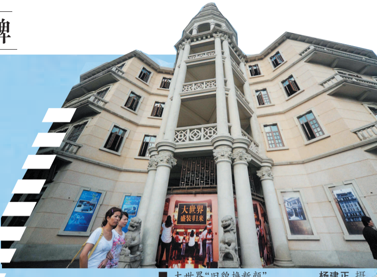
■ 大世界“旧貌换新颜”