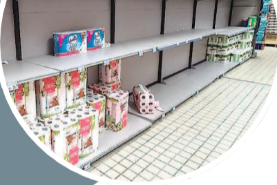
巴黎一家超市,货架上卫生纸所剩不多

法国政府发言人加布里埃尔·阿塔勒很有信心地说:“没有人不同意我们的目标,即绝对要避免法国的医院陷入无力接纳新患者的境地。”