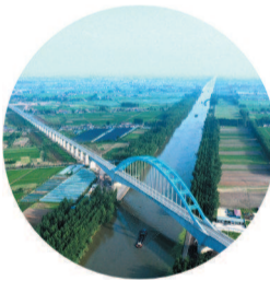
时速 350 公里的盐通高铁即将运营通车

目前,大丰建有上海市政府和江苏省政府主导、长三角地区最大的省际合作园区沪苏大丰产业联动集聚区,被纳入《国家长三角一体化发展规划纲要》,全力打造“北上海”临港生态智造城。上海光明食品集团、临港集团、上港集团、东方国际等 50 多家企业,在丰总投资超 150 亿元,随着光明食品产业园、正泰新能源 5GW 高效电池和 5GW 高效组件项目等一批新项目的建设和推进,双方