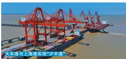
大丰港与上海港实现“沪丰通”