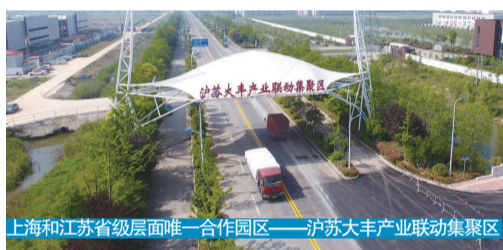
上海和江苏省级层面唯一合作园区——沪苏大丰产业联动集聚区

房及净菜加工配送项目以及 1000 万羽蛋禽、奶牛及乳制品深加工、粮食储备加工、进口牛羊肉加工、生猪屠宰深加工“五个基地”建设,打造上海域外规模最大、品质最优、生态最美的农副产品主供基地。