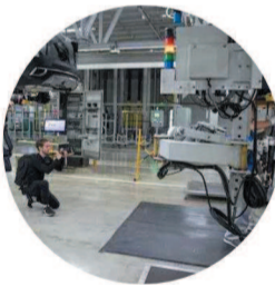
江苏省人民政府新闻办公室主办的“SHOW JIANGSU”外媒摄影采风活动走进大丰