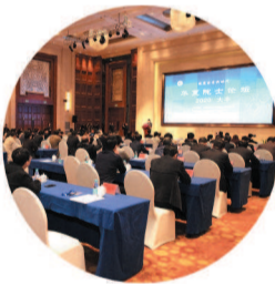
健康医学新时代——华夏院士论坛在大丰召开