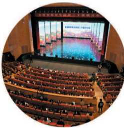
全国新教育实验第二十八届研讨会在大丰召开