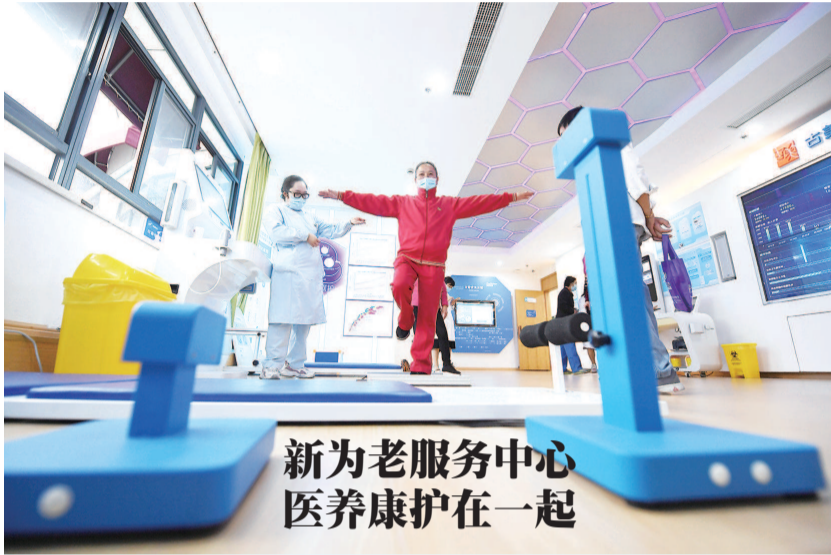
新为老服务中心 医养康护在一起

今天上午,这些参评的124个公共空间在上海市文旅局官方微信“乐游上海”揭晓,接受市民游客线上投票。活动主办方将结合市民投票结果和专家评审意见,评选出首批上海市民“家门口的好去处”,并颁发证书和标牌。