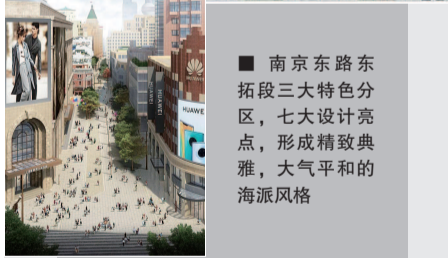
■南京路东拓段三大特色分区,七大设计亮点,形成精致典雅,大气平和的海派风格