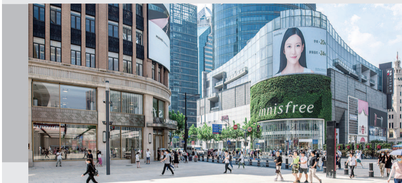
■百年南京路与滨江四十五公里岸线相通相连,南京路东拓工程让“世界会客厅”美景更好地呈现在中外游客面前