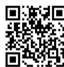
扫码看代表如何为民解难