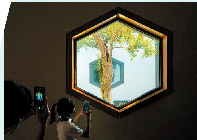
苏州博物馆独特的空间形状与视角变化别具一格