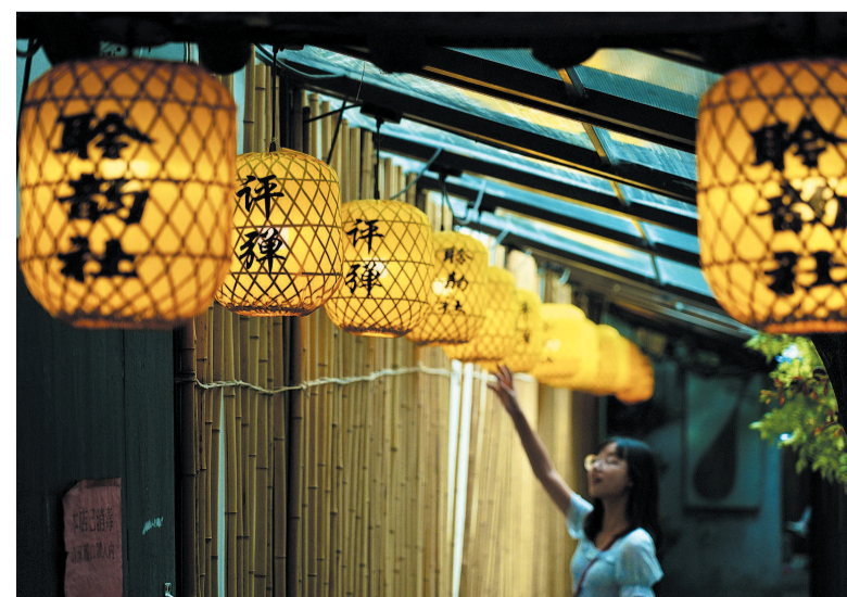
平江历史街区评弹雅韵