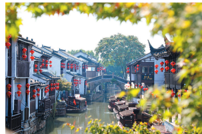
有千年历史的山塘街繁华再现