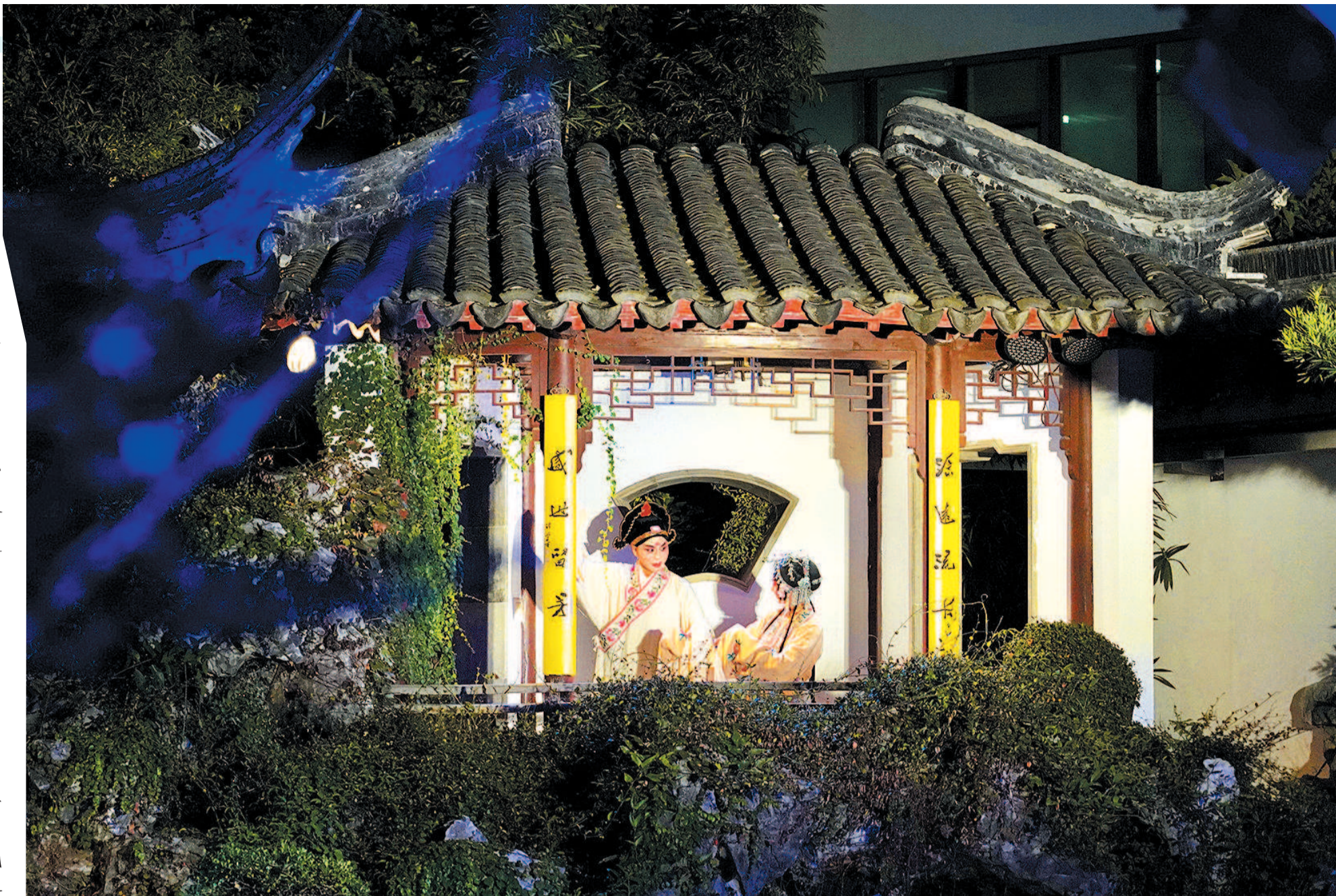
实景版昆曲《牡丹亭》