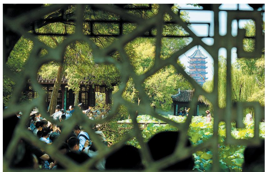
拙政园经典视角——借景北寺塔