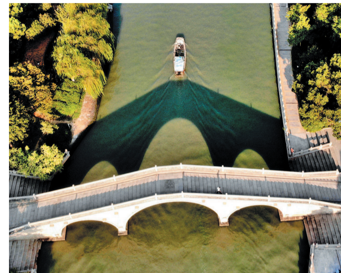
从空中俯瞰小桥流水、绿树掩映的秀景