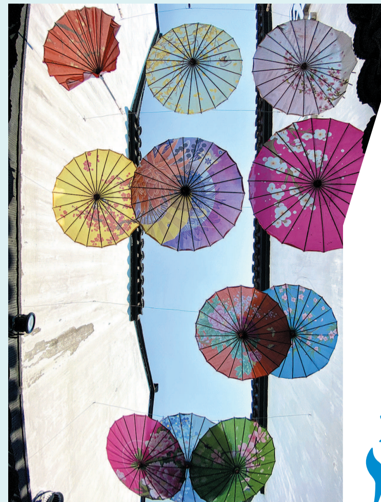
粉墙黛瓦间, 花伞点缀更添古韵

明天, 上海旅游节将拉开帷 幕。本次旅游节首次设立长三角 分会场, 实现旅游节四地联办、优 质产品和线路互动、惠民服务共 享, 共赏江南好风光。 苏州古城至今已有两千五百 多年历史, 目前仍坐落在春秋时 期的原址上, 保持着「小桥流水、 粉墙黛瓦、史迹名园」的独特风 貌。