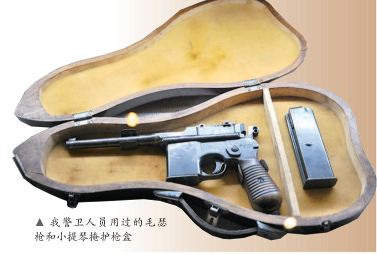
▲我警卫人员用过的毛瑟枪和小提琴掩护枪盒