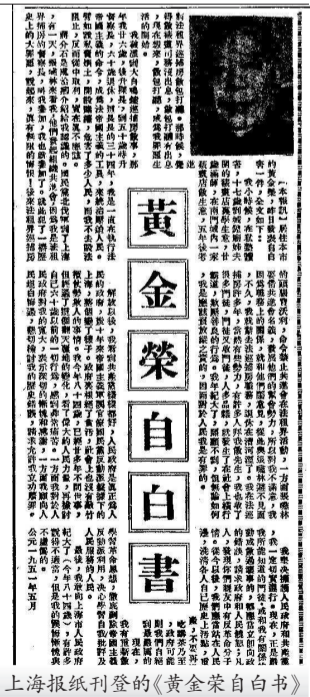
■上海报纸刊登的《黄金荣自白书》