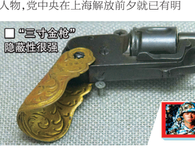
■“三寸金枪”隐蔽性很强

对像黄金荣这样的旧上海帮会头面人物,党中央在上海解放前夕就有明确方针,即只要他们不出来捣乱,不干扰上海解放后的社会治安,老实接受改造,就不动他们。1951年镇压反革命运动开始后,人民群众对黄金荣的检举揭发信如雪片一般飞进市政府和公安机关,人民政府忠实执行中央政策,出面召见黄金荣,向他说明既往政策不变,希望他能写“悔过书”公开登报,进一步向人民交代,老实认罪,以求得人民群众的谅解。1951年5月20日,上海《新闻报》《文汇报》刊出《黄金荣自白书》,旧上海大亨的忏悔在当时极具轰动效应。黄金荣响应政府改造号召,参加爱国卫生运动,还主动交出了“三寸金枪”,这些行为对稳定社会秩序,震慑帮会残余势力起到不小作用。1953年6月20日,黄金荣在上海去世,终年85岁。他所上交的“三寸金枪”留存于博物馆展柜里,向人们诉说着一个被彻底荡涤的时代。