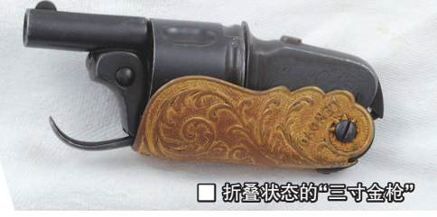
□折叠状态的“三寸金枪”