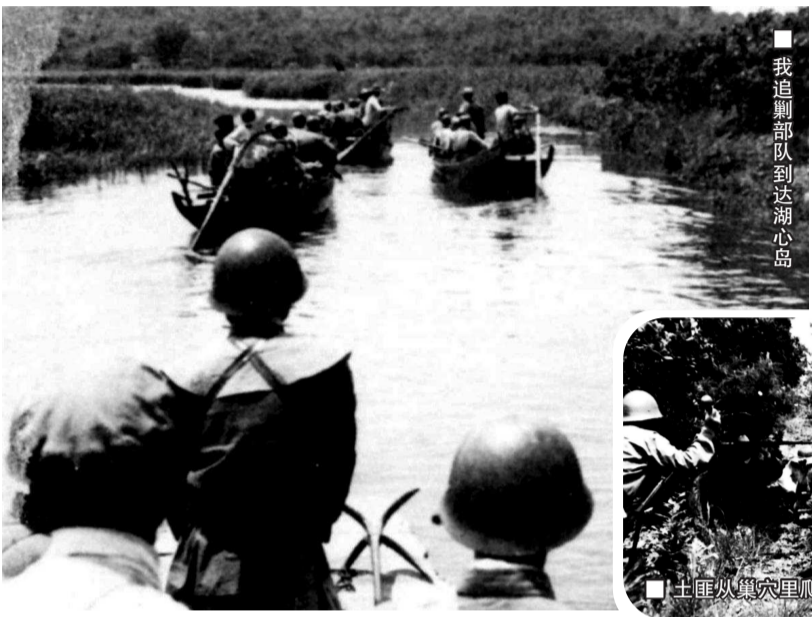
■我追剿部队到达湖心岛