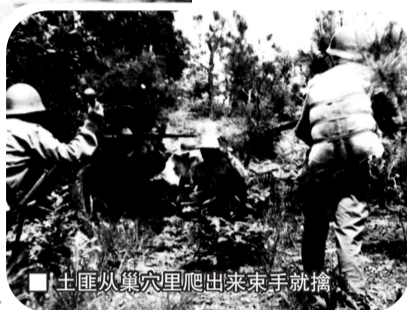
■土匪从洞里爬出来束手就擒