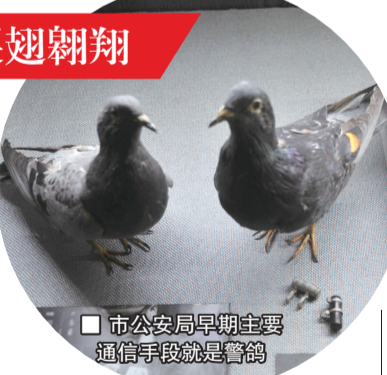
■市公安局早期主要通信手段就是警鸽

50年代初,上海市公安系统的通信工具较为原始,除了市区分局有些摇把子电话外,许多城郊偏远的分局局和派出所都没有电话。那时治安形势颇为严峻,市里还有许多潜伏特务,每天各分局都要向市局汇报治安情况和突发事件,市局也会下发协查命令,这些都离不开通信联络,而警鸽是那个时期最理想的通信工具,原来的百羽警鸽也逐步发展到2000多羽的庞大规模。上了年纪的市民还记得,新中国成立初期,上海每年欢庆五一劳动节,在人民广场上放飞和平鸽中,里面一大部分就是警鸽。博物馆展柜里,就有两只漂亮的