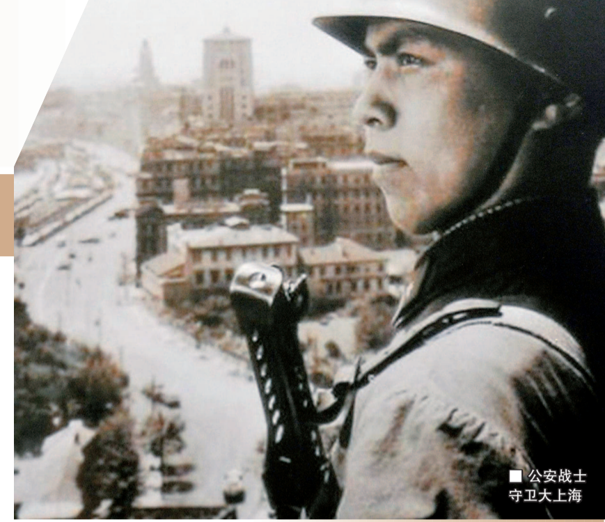
■公安战士 守卫上海