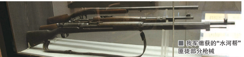
■我军缴获的“水河帮”匪徒部分枪械

10月8日,上海市公安局牵头,水上分局会同市局刑侦科、盗案科及相关分局发起围剿“水河帮”战役,先在市郊湖面上截获匪船三条,同时端掉匪帮在市区的联络点,使其信息闭塞。9日凌晨,200余名公安战士向盘踞嘉定的“水河帮”隐匿据点总攻,全歼水匪。24日,经法院审判大会审判,匪首周学高等26名罪大恶极的惯盗被判处死刑立即执行。