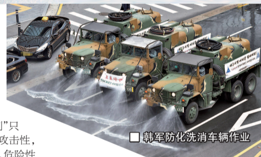
韩军防化洗消车辆作业

韩国学者认为, 从美军公开声明“在韩国取得重大试验成果”这一点看, 美军肯定使用了实际细菌制剂, 而且应该有规模堪比埃奇伍德的“微风隧道”, 对韩国来说, 这都是“不祥之物”。首尔大学教授禹熙仲表示, 美军实验室大多坐落于韩国城市群里, 在那里搞生化试验, 相当于在人口稠密区里搞核试验, 一旦出事, 后果不堪设想, 而且细菌试验的后遗症及其造成的危害无法用语言来描述。韩国《亚洲经济》称, 像群山基地内的美军实验室就毗邻釜山港, 而那里的 8 号码头正是美军经常装卸物资的要地。该码头建于上世纪 80 年代, 3 公里的范