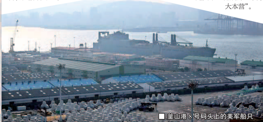
釜山港 8 号码头上的美军船只

另据报道, 作为“朱庇特计划”的后续措施, 美军已启动“半人马座计划”, 意味着美军在韩国的生化试验不会停止。韩国“绿色联合”团体代表表示: “从 2009 年至今, 驻韩美军组织了不少于 15 次生化实战训练, 严重威胁到韩国国家安全, 可我们抗议半天, 美国人依然置若罔闻, 韩国真不像一个主权独立的国家, 而像半殖民地。”《时事周刊》指出, 2006 年上映的韩国电影《汉江怪物》有一个情节是, 美军违规向汉江中倒入大量变质甲醛, 导致汉江受污染, 水中生物变异生成“怪物”。难道横行霸道的驻韩美军是要让科幻变成现实吗? 艾嘉