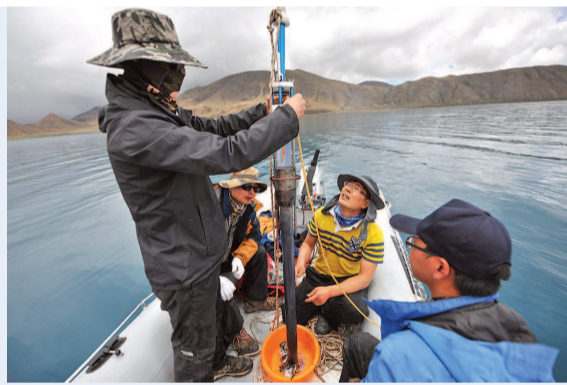
■ 科考队员在对羊卓雍错进行深度测量(2019年7月22日摄)