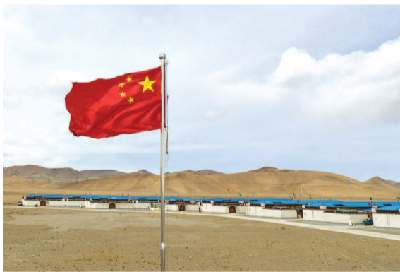
■ 中国海拔最高乡普玛江塘的边境小康村(2020年4月15日摄)