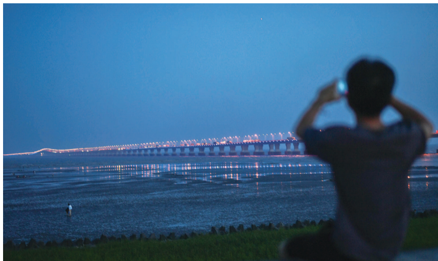
临海观桥 | 晨曦中的东海大桥让人忍不住驻足留影