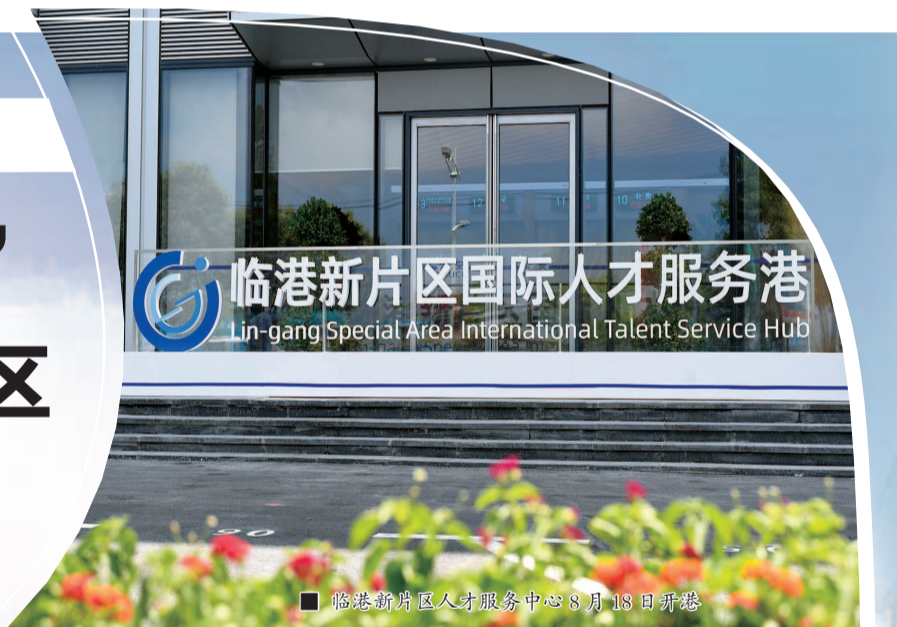
■ 临港新片区人才服务中心 8 月 18 日开港

创新和地位作用的一轮超越。6 年来,我国自贸试验区虽然取得了大量创新成果和经济效益,但存在开放格局不够、功能不全、区域隔绝性强等不足。新片区通过“差异化试验”,实现“五个重要”功能定位,将能有效地克服上述弊端,达成对现有自贸区制度创新与功能地位作用的全面超越。