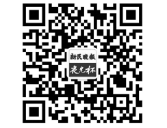
扫一扫,关注“夜光杯”