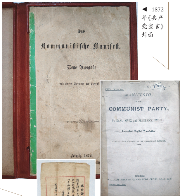
▲ 1872年《共产党宣言》封面