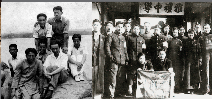
▲ 林风眠和艺专学生在沅陵合影