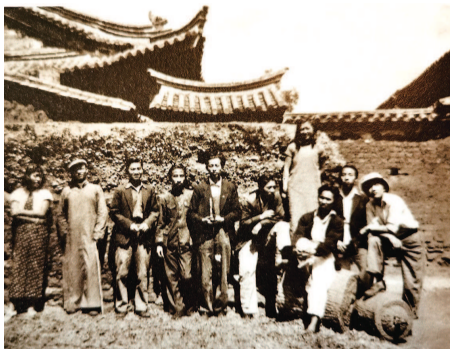
◀ 1940年夏,国立艺专江西籍学生合影于昆明安江村宿舍前