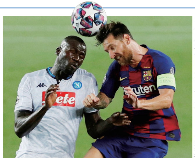
■ 梅西(右)与那不勒斯队球员争顶