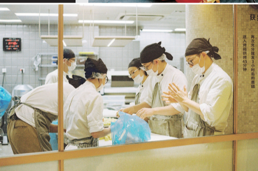
■ 点心师在烘焙室内专注地揉搓面团