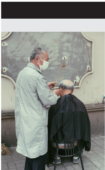
■ 街头坚持“古法”理发的老爷爷