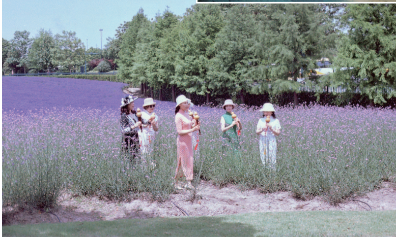
■ 身着旗袍,一同在薰衣草公园里吹笛的姐妹团