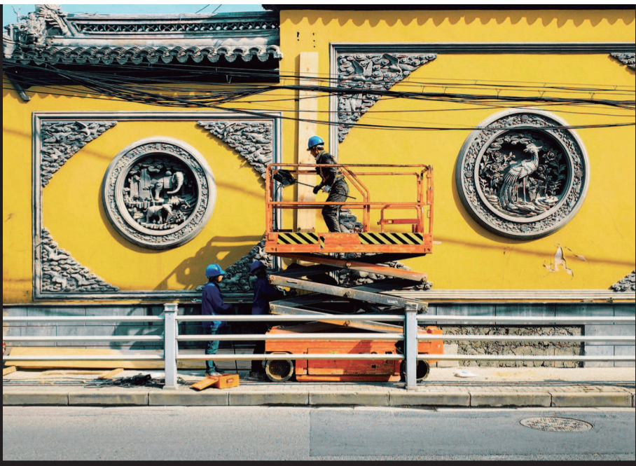
■ 为玉佛寺围墙上新漆的建筑工人