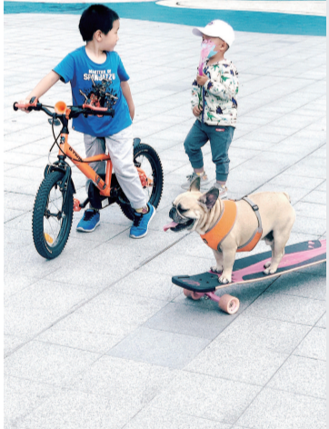
■ 看见滑板车上的狗狗,面露惊讶的小男孩们