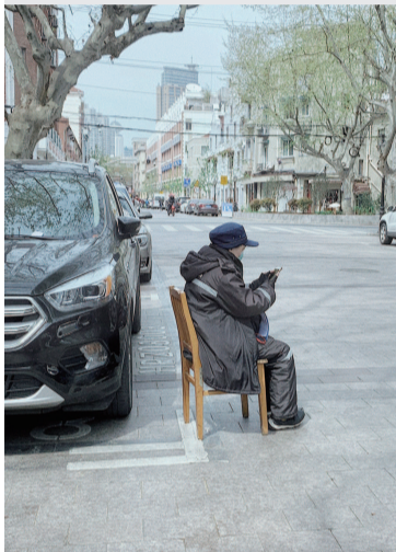
■ 等待停车收费的管理人员,在短暂的间隙中回复手机信息