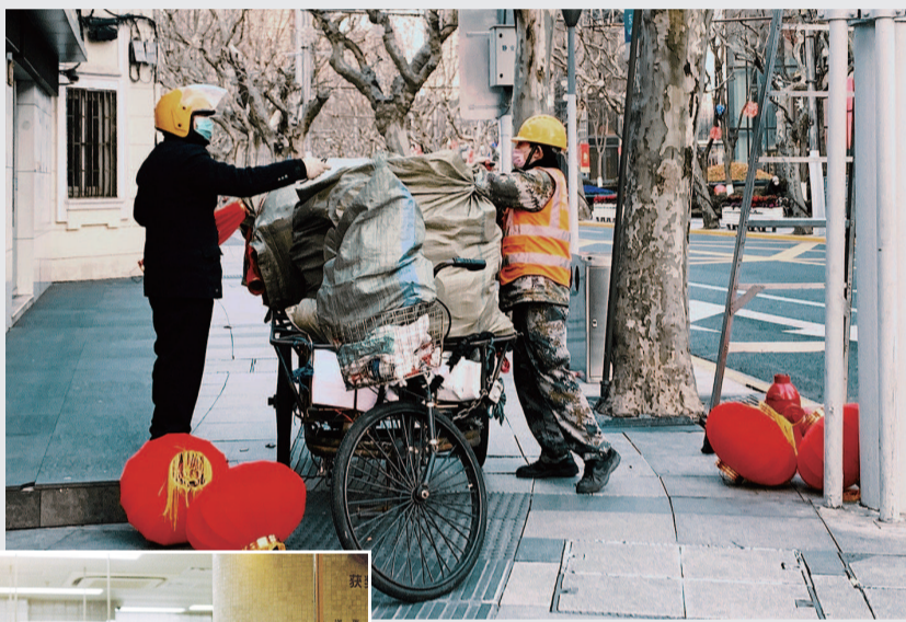
■ 美术馆门前的园丁在聊天时,仍不停下手中修整草木的工作