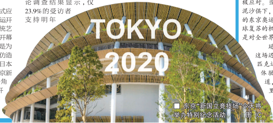
东京“新国立竞技场”今天将举办特别纪念活动