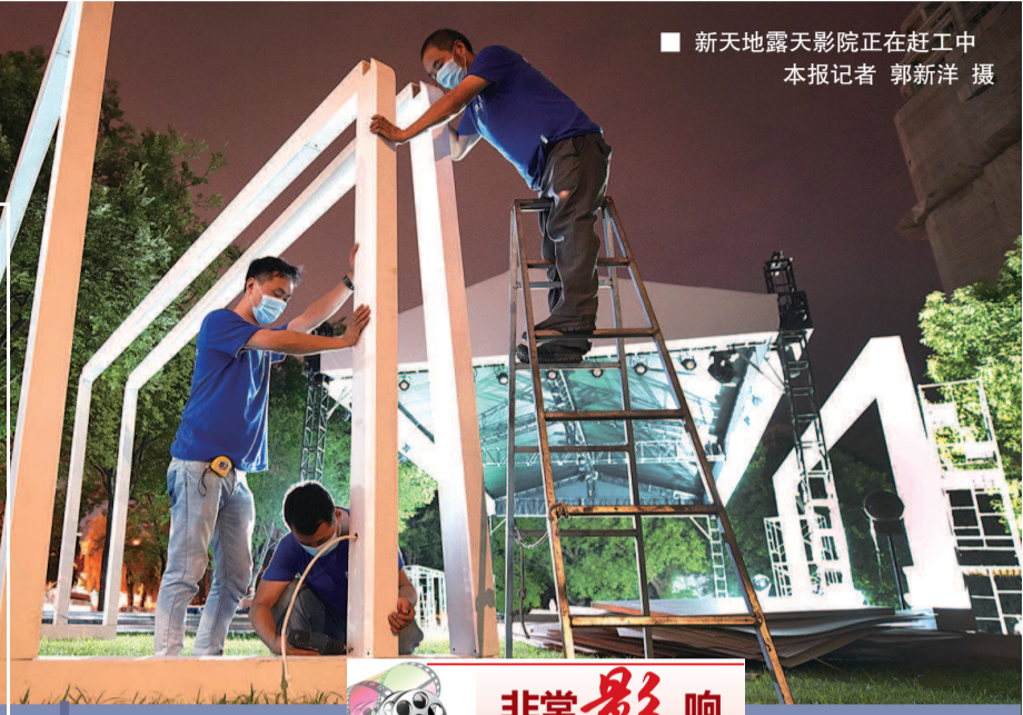
■ 新天地露天影院正在赶工中