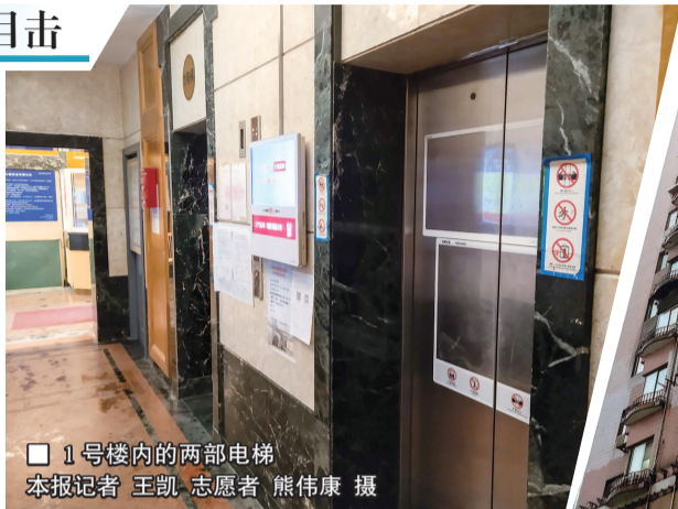
1 号楼内的两部电梯

电梯门半开卡住,轿厢内吱吱作响,运行时无端抖动……这样的电梯,你敢不敢乘?近日,不少市民致电新民晚报夏令热线,反映大热天里,进出家门必备的电梯“久治不愈”,让他们无奈攀爬十多层的高楼,难有安生日子可过。