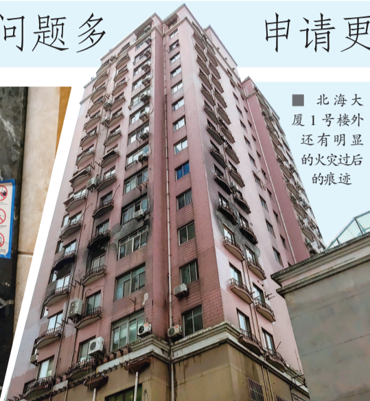
北海大厦 1 号楼外还有明显的火灾过后的痕迹