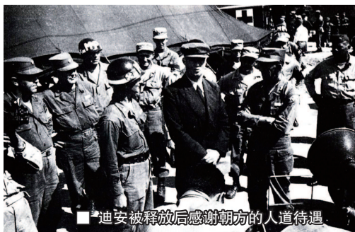
迪安被释放后感谢朝方的人道待遇