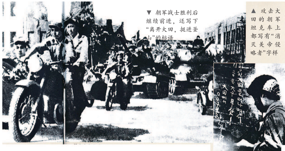
▼ 朝军战士胜利后继续前进，还写下“离开大田，挺进釜山”的标语