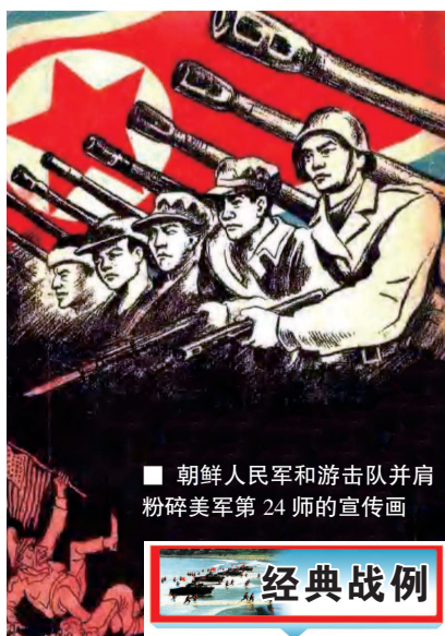
朝鲜人民军和游击队并肩粉碎美军第24师的宣传画