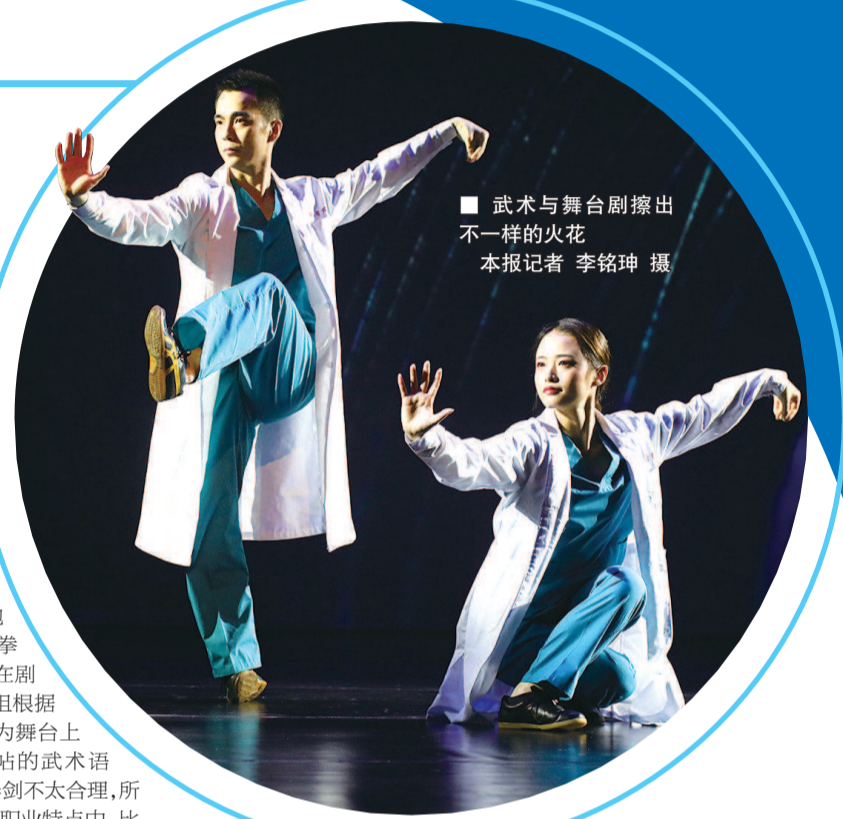
■ 武术与舞台剧擦出不一样的火花

过去大家对武术的印象可能是比赛中的套路表演和影视剧里的动作戏，但武术舞台剧《止戈抗疫》却展现了武术人更多的潜能。上海体育系统的武术人自编自导自演，歌颂抗疫英雄、传递抗疫精神。他们是如何在剧本创作、舞台表现和演员表演上完成突破的？来听听本剧的策划、导演和演员分享自己的感受。