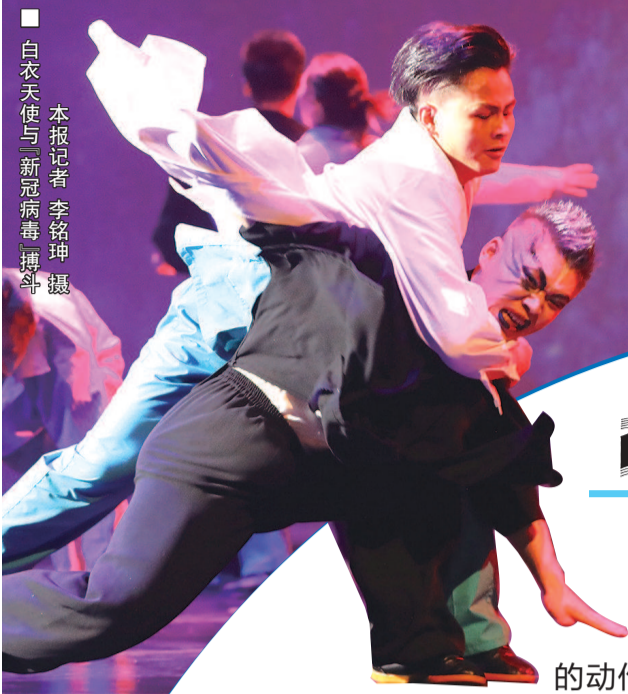
■ 白衣天使与新冠病毒搏斗