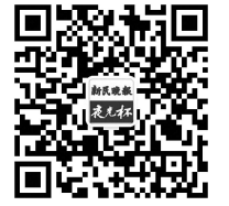
扫一扫,关注“夜光杯”