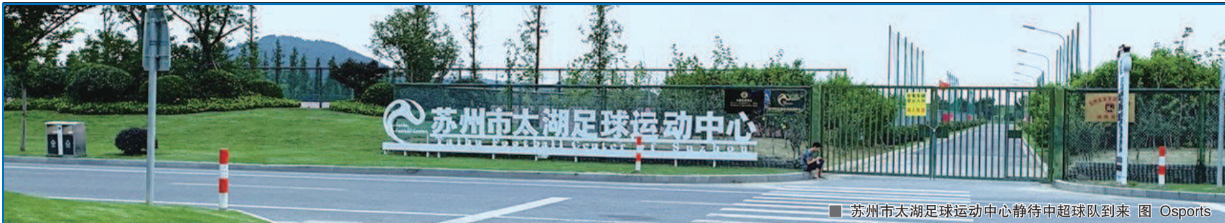
■ 苏州市太湖足球运动中心静待中超球队到来