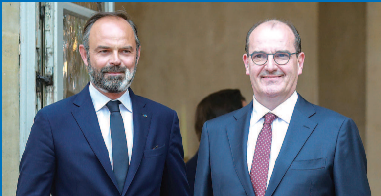
■ 菲利普(左)与让·卡斯泰

法国总统府3日突然宣布,总理菲利普向总统马克龙提交政府辞呈,并获得批准。仅过了几个小时,马克龙就任命让·卡斯泰为新总理。菲利普的突然辞职,以及被称为“解禁先生”的让·卡斯泰被迅速任命为新总理,无不令人感到意外。