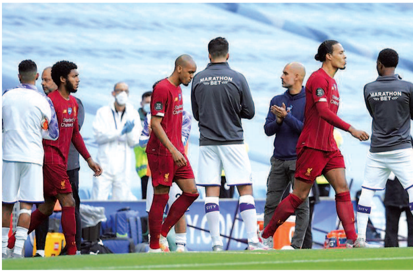
■曼城列队欢迎英超新冠军利物浦进场

对于利物浦众将而言，此战有些不堪回首。尤其是后卫戈麦斯，开赛 25 分钟他在本方禁区内拉倒曼城的斯特林，被罚点球，德布劳内主罚命中。瓜帅说：“利物浦是我遇到的最强对手，与他们比赛，我们进攻时要敢于冒险。”德布劳内和福登异常活跃，不断撕破利物浦防线，战至 35 分钟，斯特林接福登传球，晃过戈麦斯，将球打进。上半场结束前，德布