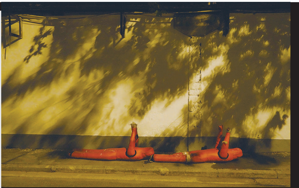
■ 上海杨浦区滨江一景(摄于2019年)