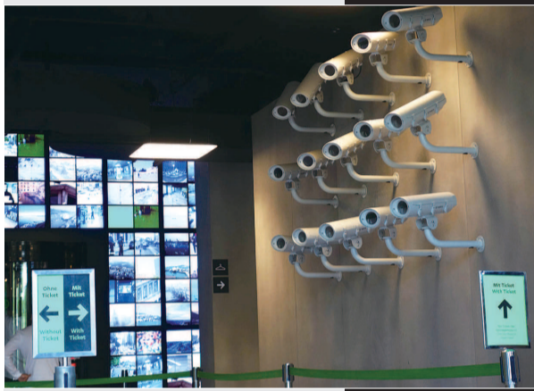
■ 柏林间谍博物馆入口