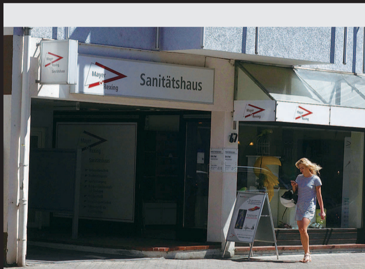
■ 海德堡安静的午后