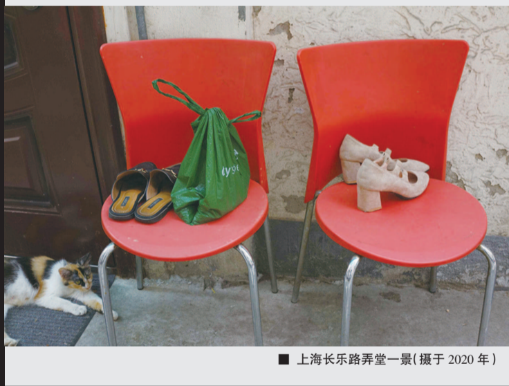
■ 上海长乐路弄堂一景(摄于2020年)