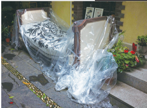
■ 上海长乐路一景(摄于2020年)