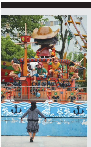
■ 上海虹口足球场外一景(摄于2012年)