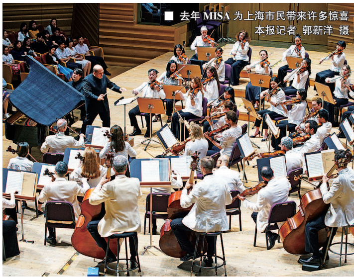
去年MISA为上海市民带来许多惊喜

2020上海夏季音乐节(MISA)“如约”而至。7月20日至7月29日,在上海交响乐团音乐厅及黄浦城市草坪音乐广场将上演17台演出。龚琳娜、李泉、霍尊、张雄关、彩虹室内合唱团等跨界IP,将和MISA艺术总监余隆、作曲家谭盾、歌唱家沈洋、黄英等古典大咖一起亮相。