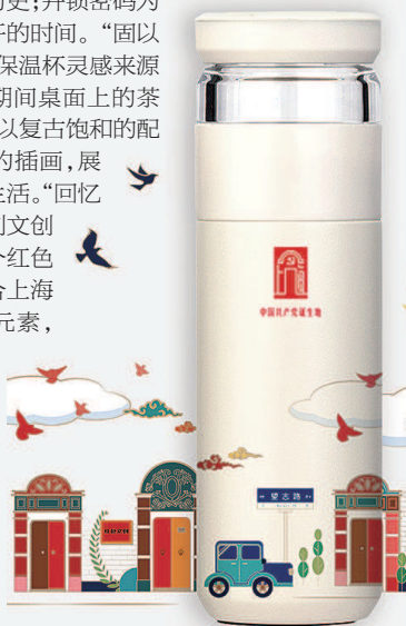
△“一大”保温杯拟人美睫 ▽石库门元素成为红色文创的灵感之一