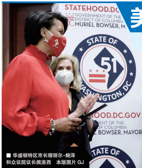
■ 华盛顿特区市长穆丽尔·鲍泽和众议院议长佩洛西