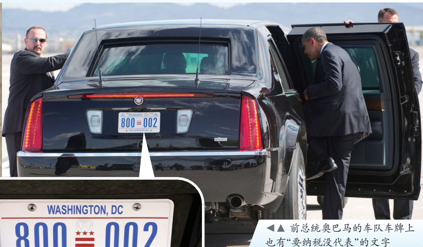
▲ 前总统奥巴马的车队车牌上也有“要纳税没代表”的文字