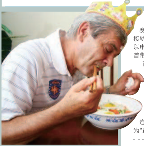
△ 桑特拉奇在中国执教时过生日