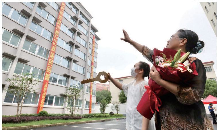
卜阿姨带着外孙女看房

武川路222弄拆除重建项目的圆满实施是杨浦区探索区校合作，简化审批流程、缩短审批时间的成果，也是按照《上海市应急抢险救灾工作管理办法》要求，探索对抢险项目进行未雨绸缪的“治未病”型改造，对今后“留改拆”城市更新理念的进一步落地开花起到了积极的探索意义。