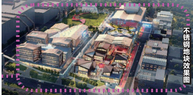
不锈钢地块效果图

本报讯（记者 叶薇 郭剑烽）作为未来上海北部城市副中心功能的承载区，吴淞工业区即将掀开脱胎换骨的崭新篇章。今天上午，吴淞创新城的中国宝武先行启动区首发地块项目从规划阶段转入实质性开工建设阶段，中国宝武吴淞园建设管理办公室揭牌。同时，吴淞国际科创城首发项目开工、吴淞国际艺术城首发项目启动，博绣荟文创园投入运营。