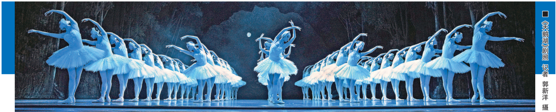
《天鹅湖》剧照