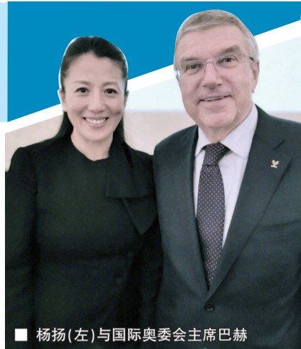
杨扬(左)与国际奥委会主席巴赫