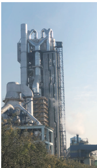
▲ 金隅鼎鑫水泥有限公司是鹿泉建材工业转型升级的缩影