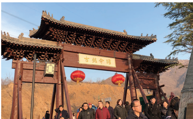
▼ 走在德明古镇仿佛穿越时空