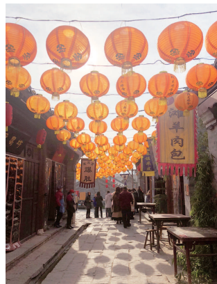
土门关驿道小镇特色美食巷