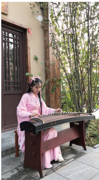
德明古镇的江南韵味