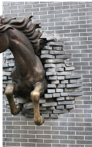
马仙破墙寓意美好

鹿泉在蝶变。自2007年以来，鹿泉区集中分批拆除水泥建材企业，向绿色、高技术产业转型。通过产业转型，鹿泉由过去华北地区“灰头土脸”的建材基地，脱胎换骨成山花烂漫、层林尽染的河北省会后花园，闯出了一条产业优、百姓富、生态好、城市美的鹿泉发展路