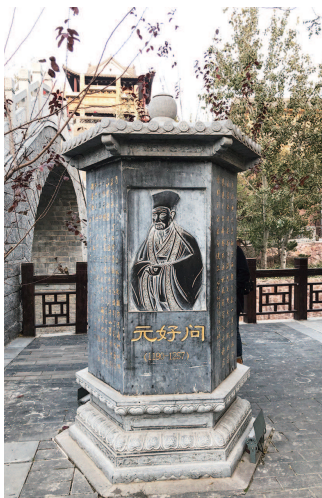
元好问晚年寓居获鹿(今鹿泉)